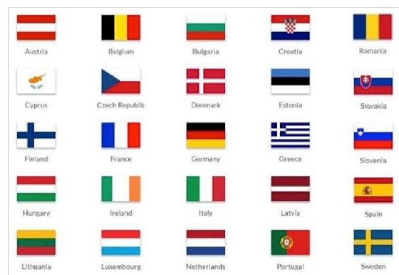
Épreuves pratiques – EUSO 2019 – Almada (Portugal)