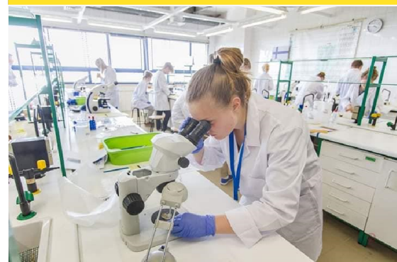
Équipe de France aux EUSO 2019 - Portugal